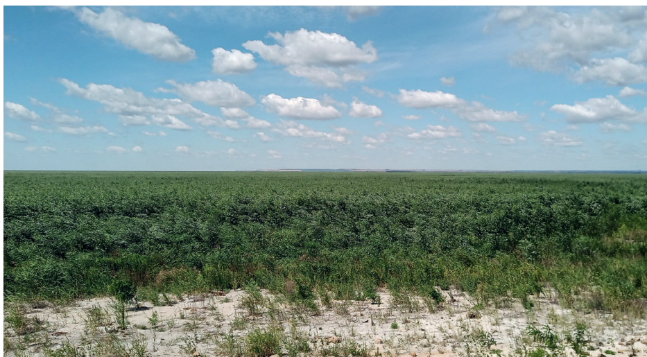
Великий Луг (Україна). Після знищення Каховського водосховища російською армією у 2023 році в долині Дніпра розпочалося природне відновлення лісів та водно-болотних угідь. Цей процес призвів до формування обширних природних оселищ, зокрема пріоритетного оселища Додатка I 91E0* – заплавні ліси з Alnus glutinosa та Fraxinus excelsior .

зауваження щодо цього питання під час перевірки транспозиції директиви до національних правових систем.