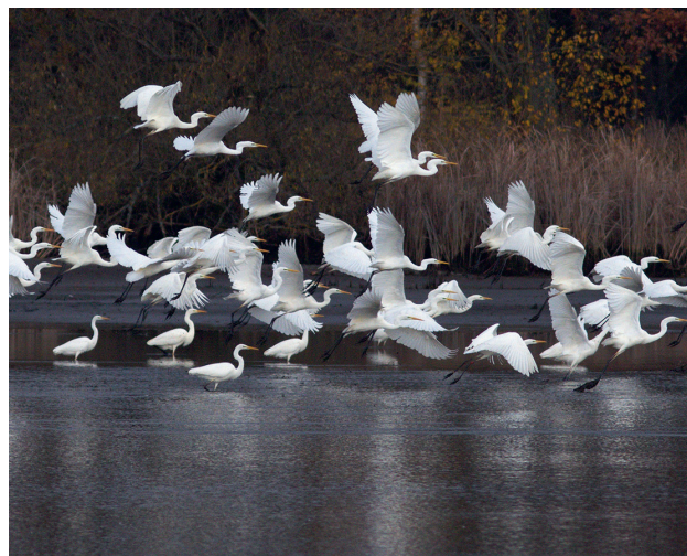
Великі білі чаплі (Ardea alba) залежать від місцевих водно-болотних угідь як ключових оселищ. Їхня охорона в межах мережі Natura 2000 забезпечує безпечне середовище для відпочинку та міграції цього чутливого виду.