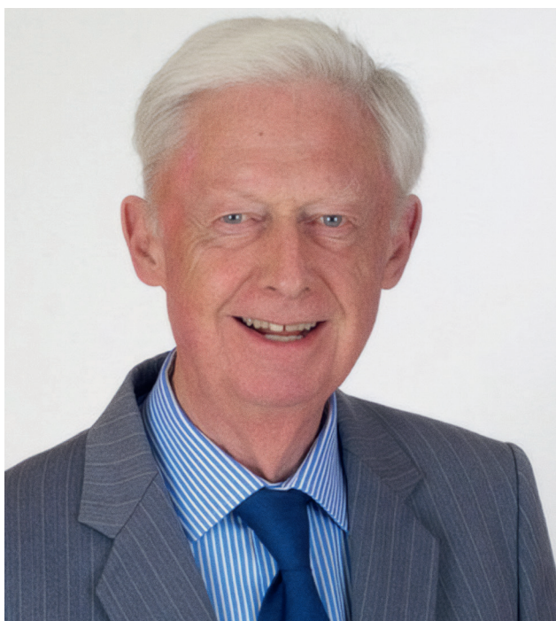
Джон Темпл Ленг

ня Стенлі Крампа (†1987), британського орнітолога, яке було зосереджене не лише на питанні полювання, а й на охороні оселищ та водно-болотних угідь. Невдовзі після цього почалися втручання мисливських коаліцій, особливо з Франції, де мисливське лобі було надзвичайно потужним; опір ухваленню директиви був дуже сильним.