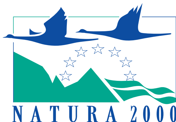
Офіційний логотип мережі Natura 2000.

Останній абзац статті 17 передбачає можливість (але не обов’язок) позначати “території, визначені відповідно до цієї директиви, за допомогою знаків спільноти”. Цей знак — це відомий логотип Natura 2000, який був вперше опублікований у 1997 році в Рішенні Комісії 97/266/ЄС, що стосувалося формату інформаційних файлів для запропонованих ділянок Natura 2000 19 , а згодом офіційно закріплений (з детальним описом правил його використання) у Рішенні Комісії 2021/C 229/03 щодо ліцензування логотипу Natura 2000 20 . Наразі немає даних про те, чи використовували держави ЄС цей логотип і в якій кількості для позначення своїх ділянок Natura 2000.