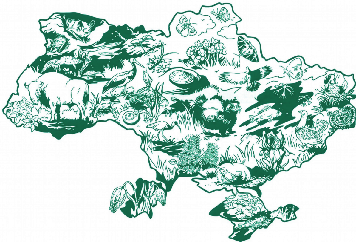
Карта України із зображенням окремих видів, що мають національне та загальноєвропейське природоохоронне значення. Дизайн створено в межах проекту ConNaturLIFE Ukraine.

Автор: Петр Рот Переклад українською: Олександра Резник, Олена Кривик Дизайн: Їржі Калачек © Агентство охорони природи Чеської Республіки, 2025