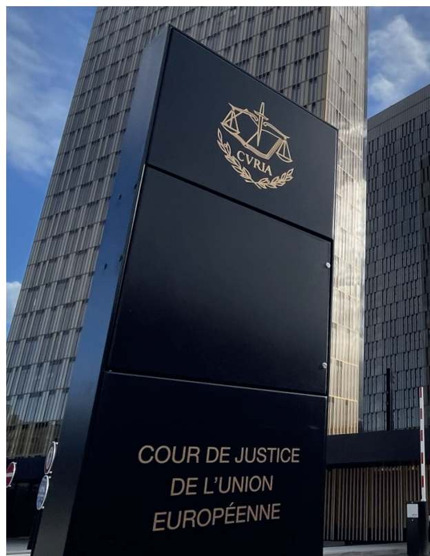
Знак перед комплексом Суду ЄС, Люксембург.

У деяких випадках окремі положення директиви, які мають ключове значення, але подані надто стисло, стають предметом кількох різних рішень Суду ЄС, що пояснюють їхній зміст і застосування. Наприклад, лише пункт 3 статті 6 Оселищної директиви, який стосується оцінки планів і проєктів, що можуть вплинути на території Natura 2000, — надзвичайно складне питання, яке потребує точної та ефективної транспозиції, — був додатково роз'яснений у близько 25 рішеннях Суду ЄС.